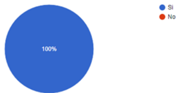
¿Crees que esta situación ha afectado la salud de la comunidad? 12 respuestas